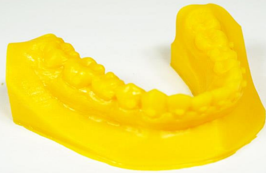
Medical Research: Dental Model