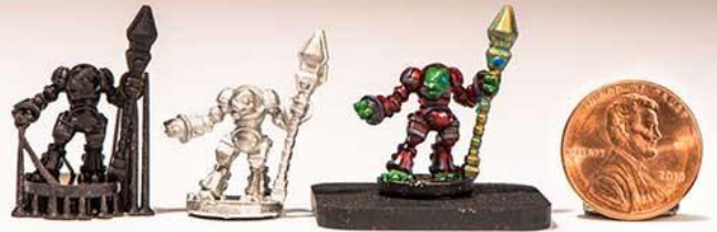
Gaming: Vulcanized Metal Miniatures

高速造形を利用して ゲームやフィギュア、 工業分野における プロトタイプ品の応用例