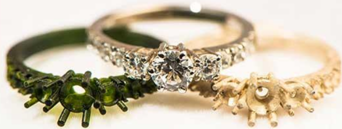
Jewelry: Casted Ring